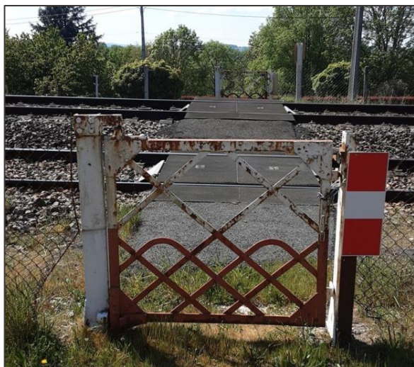
PN228 à Commentry.

Le PN n°228 est un PN de 3ème catégorie : PN ne pouvant être utilisé que par les piétons, à leurs risques et périls, sans surveillance spéciale par un agent du chemin de fer. Situé sur une ligne avec voyageur, il est équipé de portillons équilibrés à la fermeture, non fermés à clé et manœuvrés par les piétons